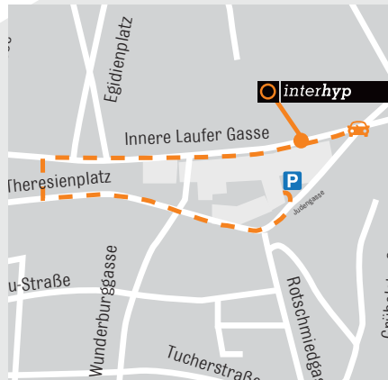
Einfahrt zur Tiefgarage

Interhyp AG Innere Laufer Gasse 24 / Judengasse 90403 Nürnberg